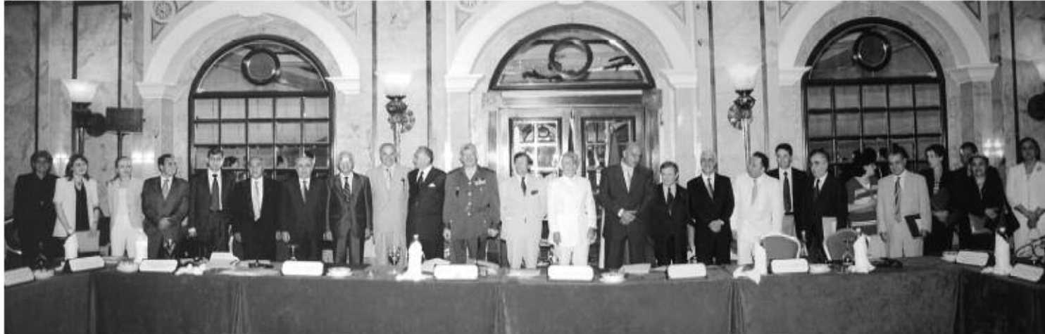
SELDAS Launching Ceremony (June 6, 2003 - Phoenicia Intercontinental)

In the Context of the World Environment Day and the Tenth Year Anniversary of the Ministry of Environment