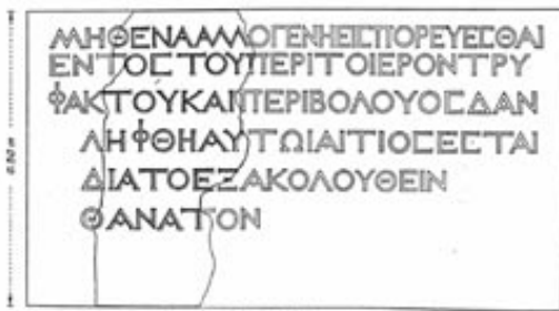
Fig. 1. Inscription from Herod's Temple (reconstruction).

"تدعونا الشريعة إلى اعتبار الله سيد الكون وتكلف الكهنة خدمة الشؤون الأساسية. فوق ذلك يجب على رئيس الكهنة أن يحكم على الكهنة ... هناك هيكل واحد لإله واحد ... الهيكل هو لكل البشر كما أنّ الله هو لكل البشر ... على رئيس الكهنة أن يقدم ذبائح لله مع كهنته وعليه أن يسهر على حفظ الناموس وأن يجزم المناظرات وأن يعاقب الأشرار..." ١٨